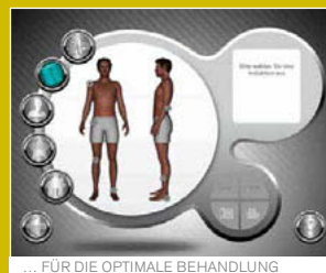
... FÜR DIE OPTIMALE BEHANDLUNG