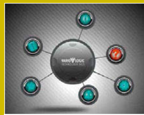
EINFACHE BEDIENBARKEIT ...