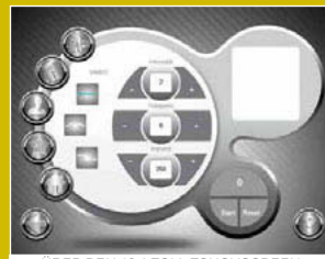
... ÜBER DEN 10,4 ZOLL TOUCHSCREEN ...