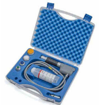
Abbildungen zeigen Ausstattungsvarianten

Gerätewagen mit großen Rollen für optimale Bewegungswege, inkl. Halterung für das Handstück, Kabelaufwicklung, Halterung für eine Gelflasche, integrierter Zubehörkoffer